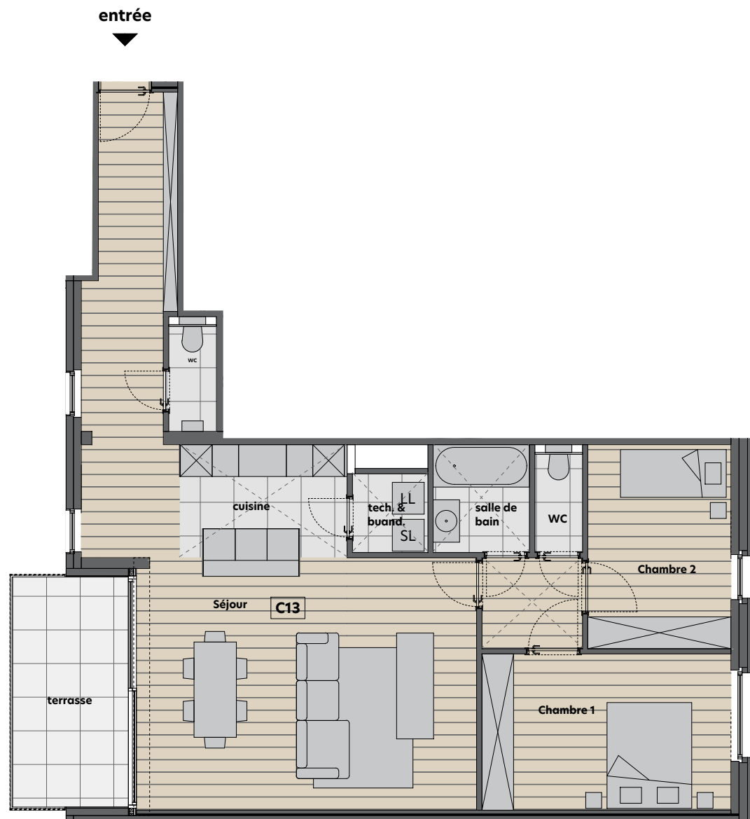
Plan R+1 1/100

Séjour : 41.4m 2 Chambre 1 : 13.9m 2 Chambre 2 : 10.4m 2