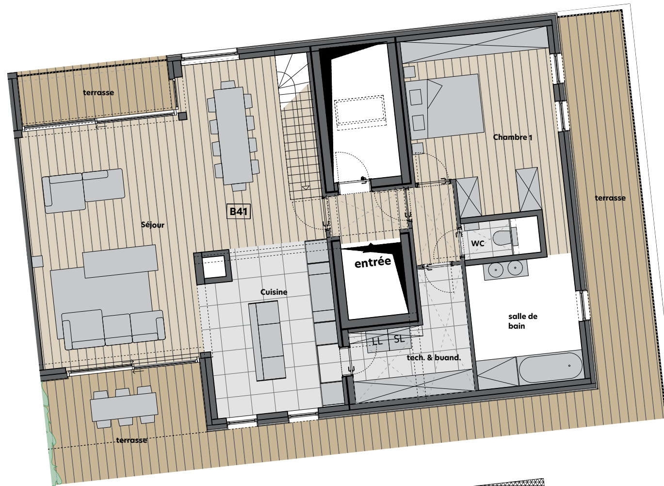
Plan R+3 1/100

Séjour : 63.1m 2 Chambre 1 : 19.1m 2 Chambre 2 : 15.2m 2 Chambre 3 : 18m 2 Chambre 4 : 9.5m 2