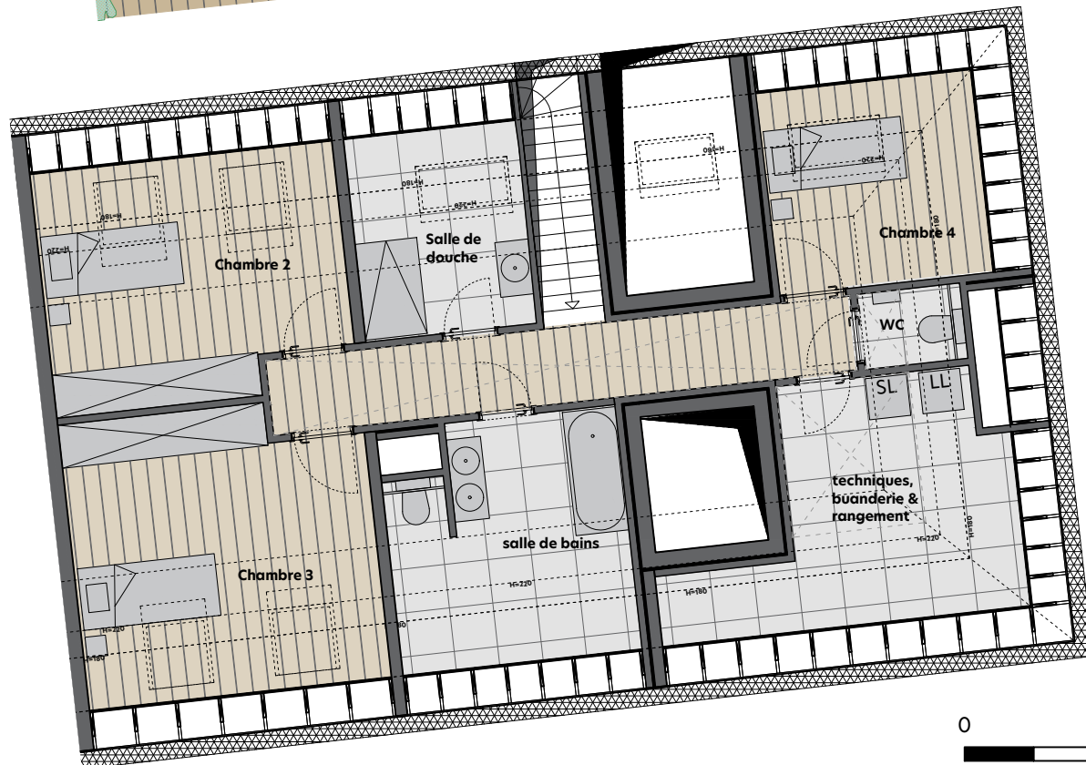
Plan R+4 1/100